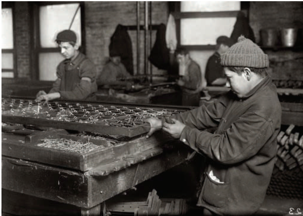
Boston, Massachusetts. January 25, 1917. "Boys linking bed-springs. 14 and 15 years old."