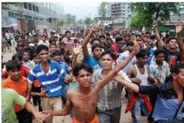
Από τις απεργίες των εργατών στον ιματισμό

http://www.safety2014germany.com/en/imfp/imfp.html